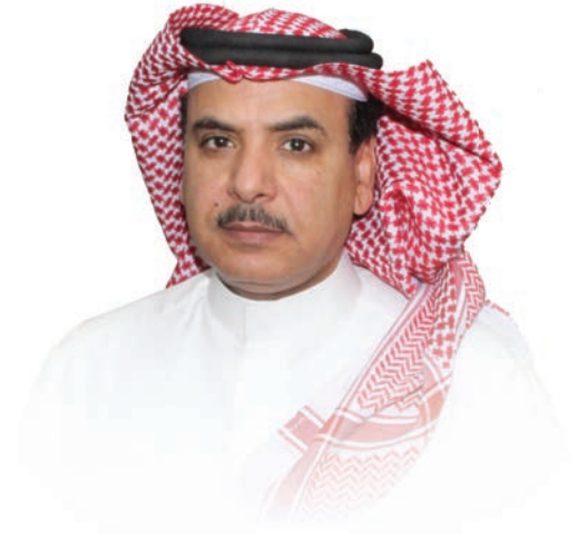
الدكتور / تركي بن محسن الحربي